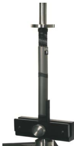
定剂量注射笔推拉测试