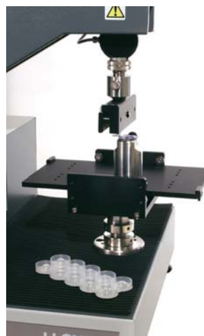
隐形眼睛剥离力测试