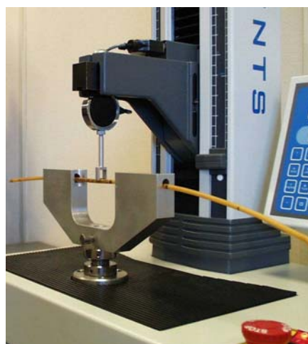
气管导管三点弯曲测试